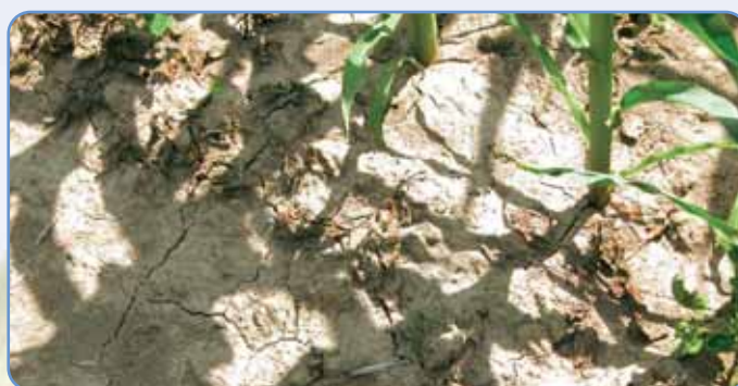
Tri tjedna nakon primjene PEAKA 75 WG